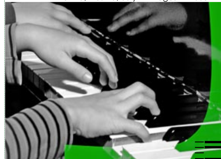
Vienna International Pianists